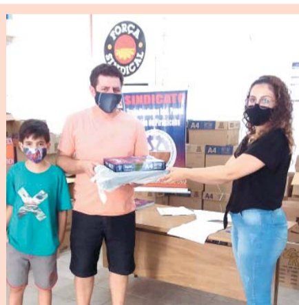
O kit de material escolar é uma conquista do Sintipel e está assegurada na nossa convenção coletiva

Em assembleia de votação secreta, promovida pela diretoria do Sintipel, mais de 91% dos trabalhadores participantes do processo aprovaram a renovação do acordo coletivo de trabalho sobre o Sistema de Compensação de Horas na Oji Papéis, que vale para todos os funcionários da empresa. Foram registrados 257 votos, sendo 236 favoráveis à renovação do acordo, 19 contrários, um nulo e um em branco. Página 04