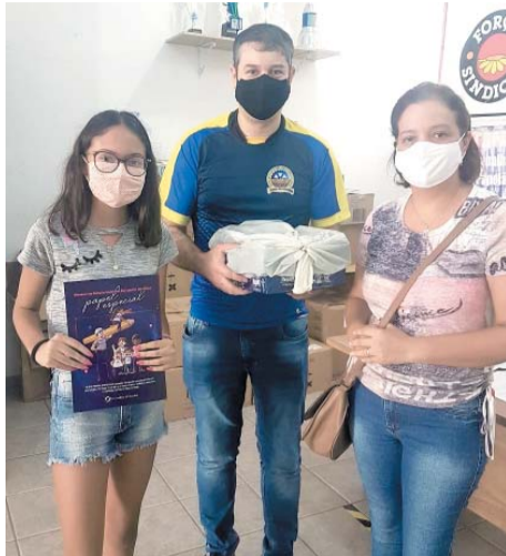
O kit de material escolar é uma conquista do Sintipel e está assegurada na nossa convenção coletiva

Os kits foram entregues para alunos do primeiro ao quinto ano e para os do sexto ao nono ano do ensino fundamental. "Mesmo com aulas virtuais, nesse momento, em função da pandemia do coronavírus, é indispensáveis esses materiais para que os alunos possam estudar e aos pais uma economia providencial nesse momento em que todos estamos fazendo contenção de gastos", observa.