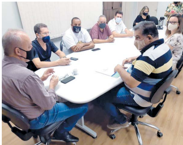
Na reunião na Câmara, os dirigentes sindicais se posicionaram contra o projeto de unificação das secretarias