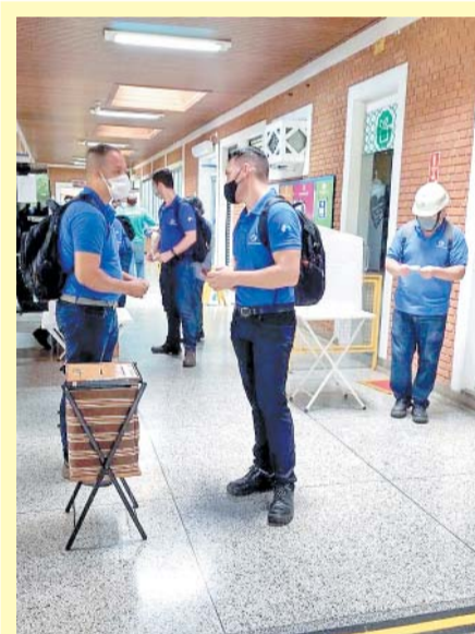
Aprovação da renovação do acordo de banco de horas na Oji Papéis

O PLR referente ao ano passado, pago no primeiro trimestre deste ano, pelas principais empresas do nosso setor, mesmo diante de toda crise vivida em função da pandemia do coronavírus, foi um dos melhores de todos os tempos, e garantiu ganhos extras aos trabalhadores da nossa categoria. Sem dúvida alguma, o PLR, uma conquista assegurada na nossa convenção coletiva de trabalho, negociada e assinada pelo Sintipel, é o resultado do esforço de cada companheiro trabalhador. Página 03