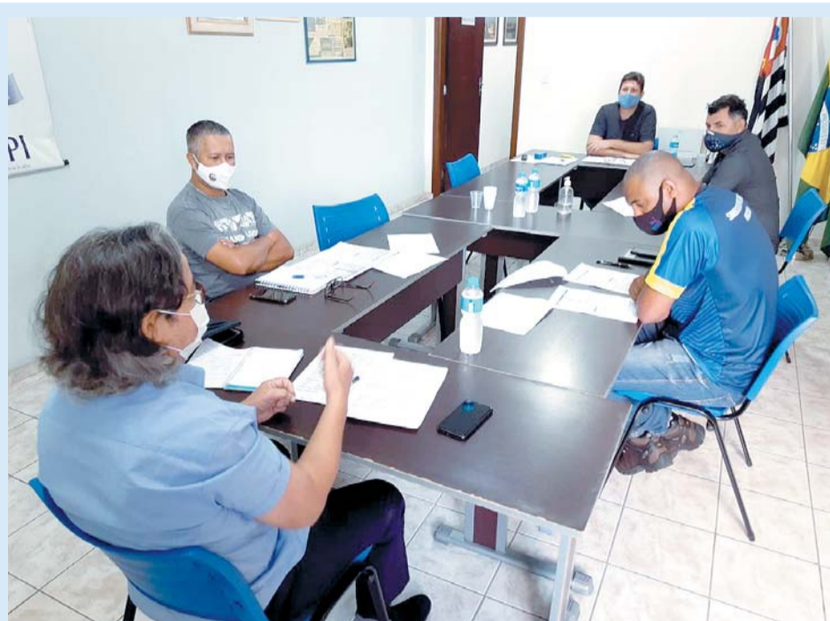
Na reunião da diretoria do Sintipel, com diretores que integram a Klabin, foi apontada a necessidade de mudanças na proposta