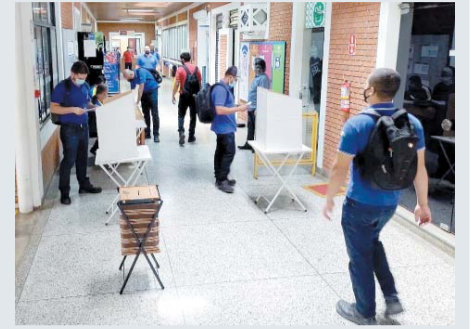
Foram registrados 257 votos, sendo 236 favoráveis

do acordo que tem validade por mais dois anos, nas mesmas condições do atual, com validade de dois anos. "Com certeza, a ampla maioria dos trabalhadores entendeu os benefícios deste acordo e aprovou a sua renovação, uma vez que é bastante flexível e acaba trazendo ganho tanto para os trabalhadores, que podem tirar dias de folgas para resolver pendências pessoais, inclusive para lazer, assim como para a empresa, no caso de necessidade", ressalta o presidente do Sintipel.